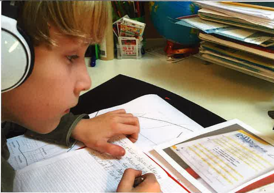
Hausaufgaben mit „wingwave children“.